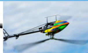
BeastX-Technologie BEASTX Technology