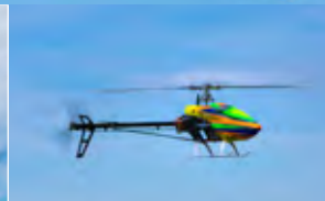
Kompatibel mit 6S Compatible with 6S